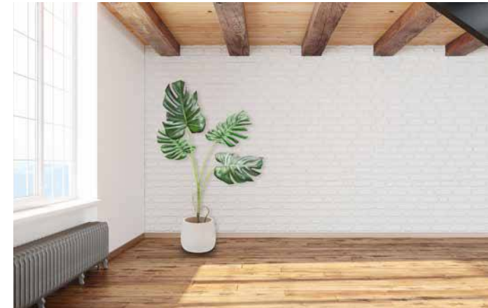
Rustikale Decke mit Douglasie Naturholzplatten

Bei Einsatz der Naturholzplatten vita für tragende Anwendung können die charakteristischen Werte für die Berechnung und Bemessung von Holzbauwerken der EN 12369:2008 Teil 3 entnommen werden.